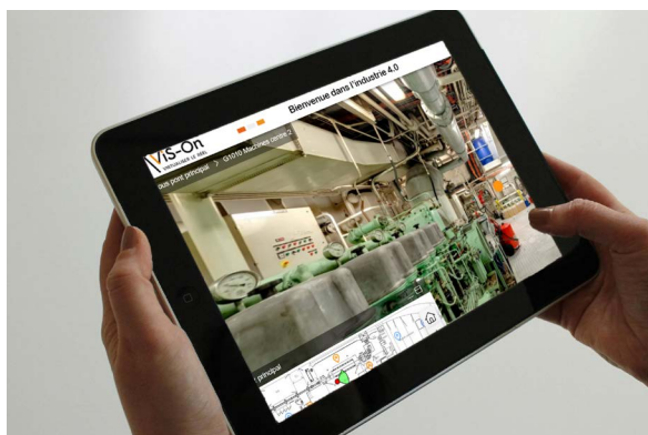
Navirothèque de l'ENSM

La « Navirothèque » est une bibliothèque de jumeaux numériques de navires de la Marine Marchande. Ces « clones virtuels » permettront aux élèves d'avoir une première familiarisation avec les équipements des navires ; exploration libre et parcours thématiques permettent une illustration contextualisée des enseignements de l'École.