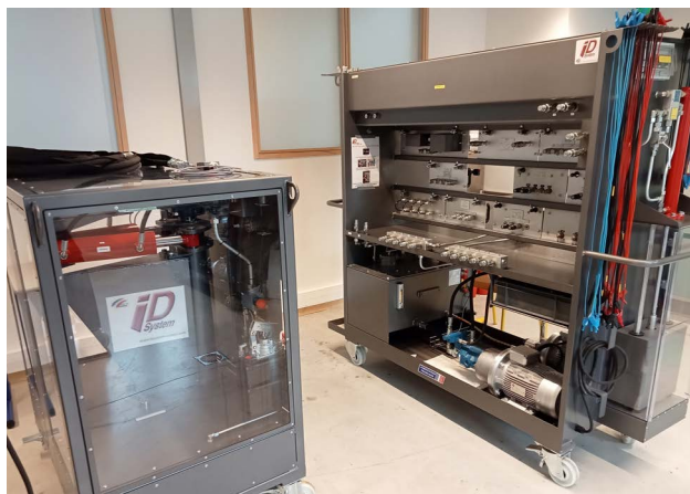
Installation simulant un appareil à gouverner

En 2023, l'ENSM a contribué à la formation des officiers de la Marine Marchande et des ingénieurs en génie maritime en investissant dans de nombreux équipements pédagogiques, notamment un simulateur d'un appareil à gouverner.